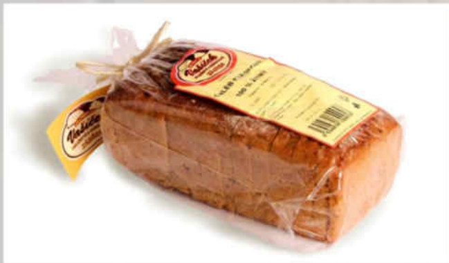
2000: Chléb tradiční kváskový 100% žitný, BK Hmotnost: 500 g, trvanlivost: 5 dnů