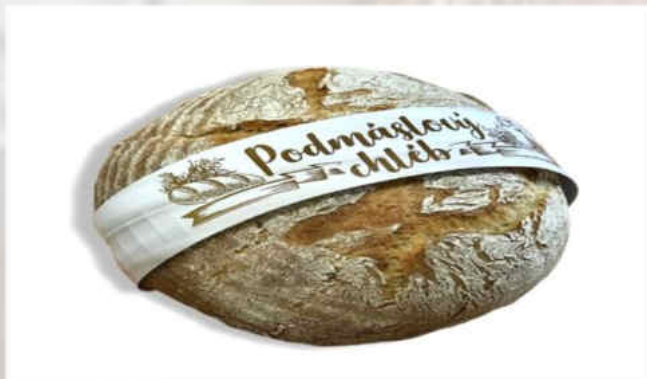
2013: Chléb Podmáslový – odpolední závoz Hmotnost: 475 g, trvanlivost: 2 dny