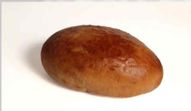
2008, 2009: Chléb tradiční kváskový „Vašík“- ranní + odpolední závoz Hmotnost: 450 g, trvanlivost: 2 dny