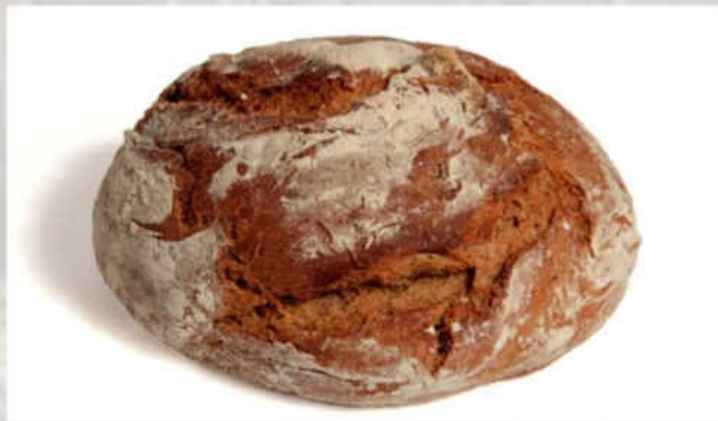
2001: Chléb kváskový Farmářský Hmotnost: 620 g, trvanlivost: 2 dny