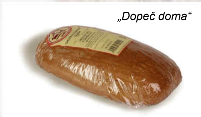
2007: Chléb tradiční kváskový „DODÍK“, B Hmotnost: 450 g, trvanlivost: 2 dny