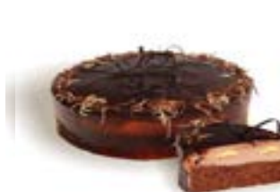
Banánový Paříž dort